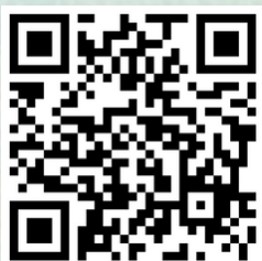
QR-koda do prijavnega obrazca

Prav tako izpolnite spletno prijavnico s klikom na povezavo: https://forms.office.com/r/u3aCypUb6j ali s pomočjo spodnje QR-kode.