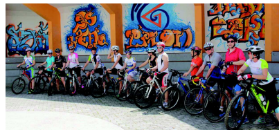
9. tradicionalno kolesarjenje zaposlenih SŠ Veno Pilon Ajdovščina od Ajdovščine do Ankarana

najst deklet prvega in drugega letnika obeh programov je pisalo citate in fragmentarne zapise iz Pilonove avtobiografije na ribo-ten z njimi popisalo pešpot od srednje šole do Pilonove galerije. Pri svojem delu so dekleta naletala na raznovrstne, predvsem pa pozitivne, odzivne mimoidoči Ajdovcev. Tako popisane ta bodo dajala Ajdovščini dušo mesta kulture vsaj še leto dni, obenem pa nas uvajajo v obeležje