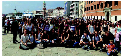
Strokovna ekscurzija 3. letnikov PV v Benetke

deželi. Članica zbora je tudi Slovenka, kar je le še dokaz več, da imajo Slovenci pomembno vlogo pri spodbujanju podobe deželo.